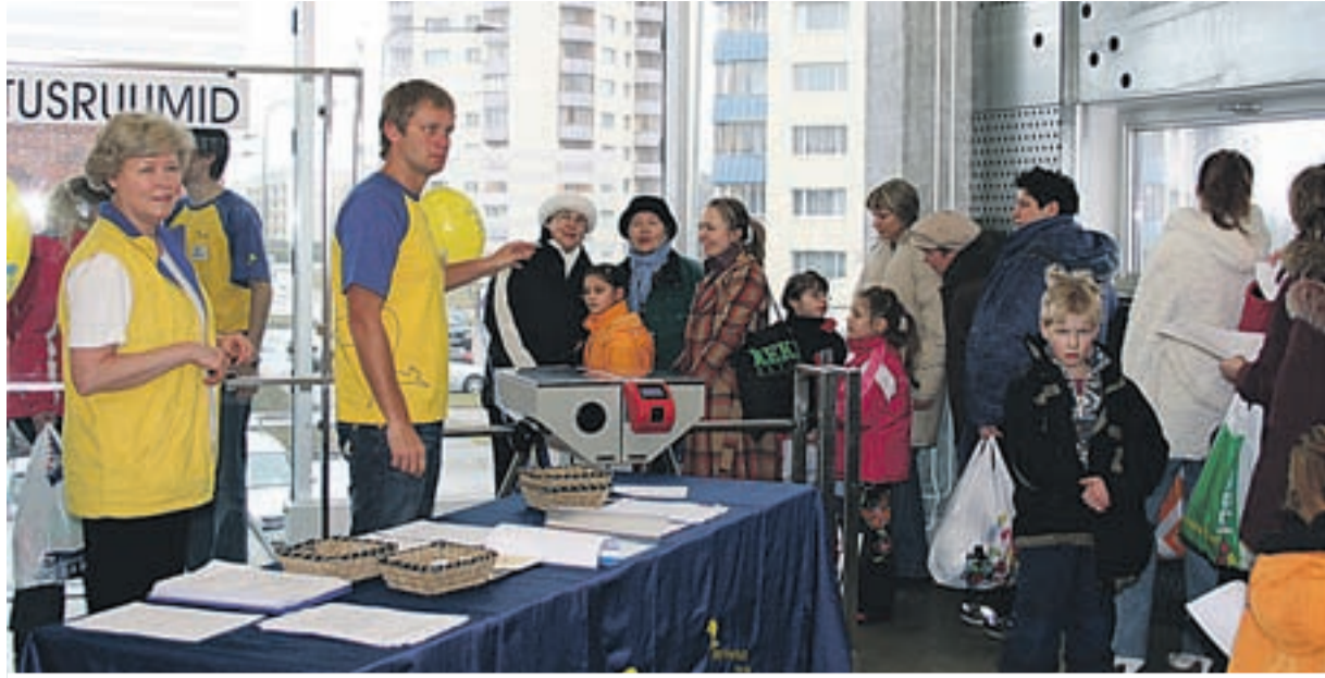
➔ Tervise kontrollpunktis mõõdeti, kuulati ja jagati arsti nõuandeid.

15. märtsil korraldas Reformierakond Haabersti Õismäe Vabaajakeskuse ujulas suure kogupereürituse, millest võttis osa ligi 300 inimest. Kõik osalejad said nautida veemõnuseid, vesiaerobika- ja ujumistunde, läbiviimise tervisekontrolli ja turgutati end vitamiinidega. Avanes ka suurepärase võimalus südamele ära rääkida ja ise küsida otse allikaltel – kohal olid mitmed parlamendisaadikud. Pereürituse eesmärgiks oli õismäelasi ergutada tervislike eluviiside harrastamisel. Rõõmu ja positiivseid elamuusi jätkus kogu laupäevaks.