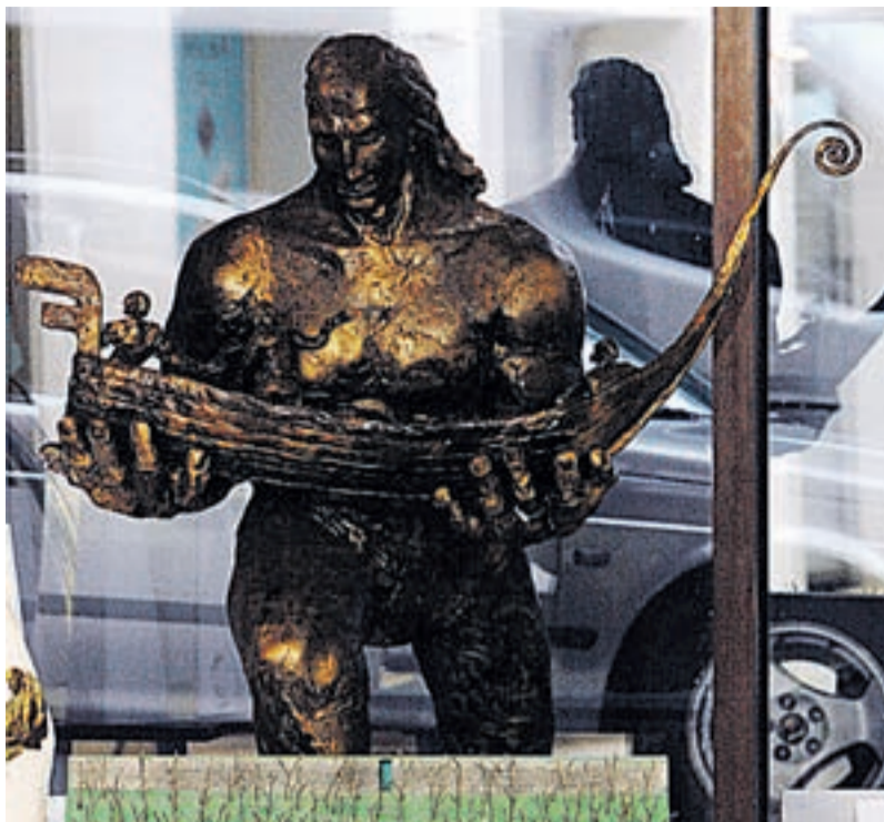
Lisaks merrepaigutatavale kujule maksab Tallinna linnavalitsus kallilt kinni ka selle kipsmaketi.