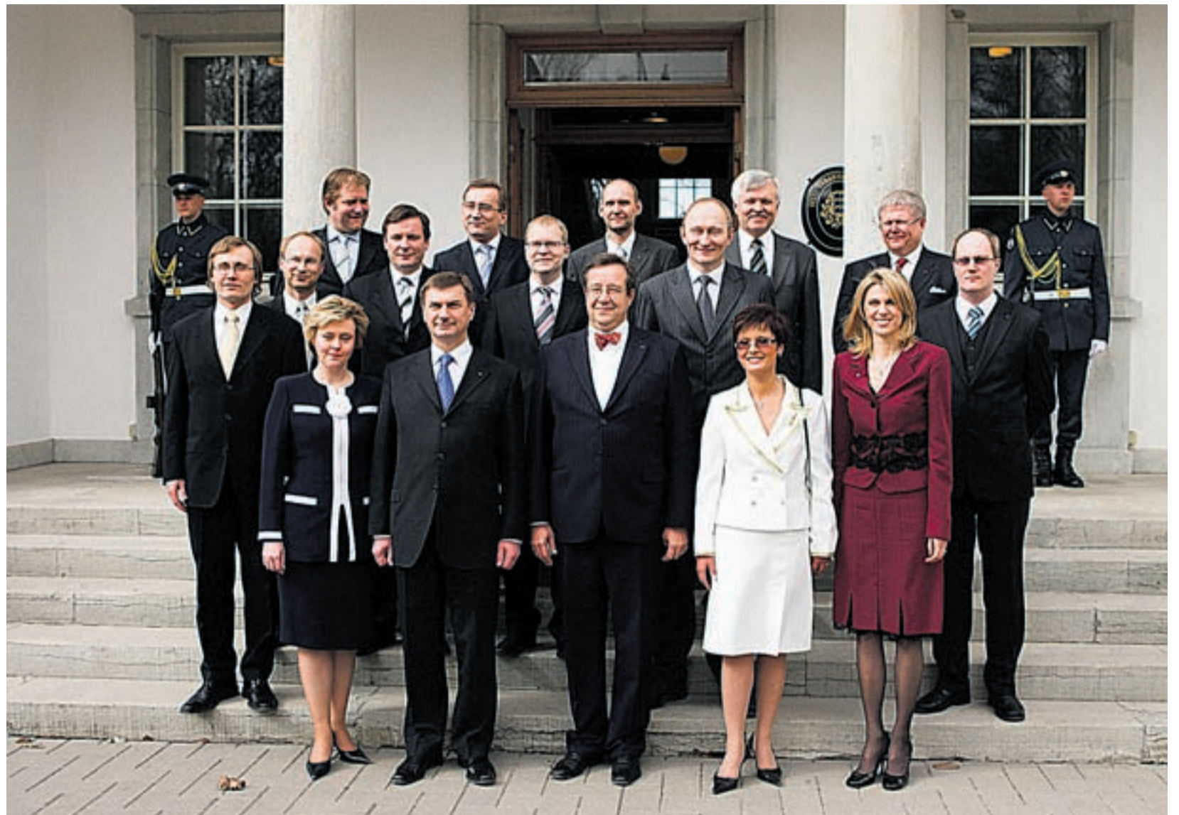
Aastatagune pildimeenus Andrus Ansipi valitsuse ametisseastumisest.

Töömessil, mille eesmärgiks oli viia kokku nii töötajad kui ka tööpakkujad, osales sadu ettevõtjaid ja töövajajaid. Messi korraldas Euroopa Komisjoni INTI projekti raames Kaubandus-Tööstuskoda koostöös Tööturuametiga, Integratsiooni Sihtasutuse ja Rahvastikuministri bürooga. Messil vahendati tööpakkumisi eri vanuses ja erineva hariduse ja keelteoskusega inimestele üle Eesti, pidades silmas niihasti kvalifitseeritud spetsialiste kui ka abipersonali, neid, kes on hetkel töötud, ja ka parema ja tasuvama töökohta otsijaid.