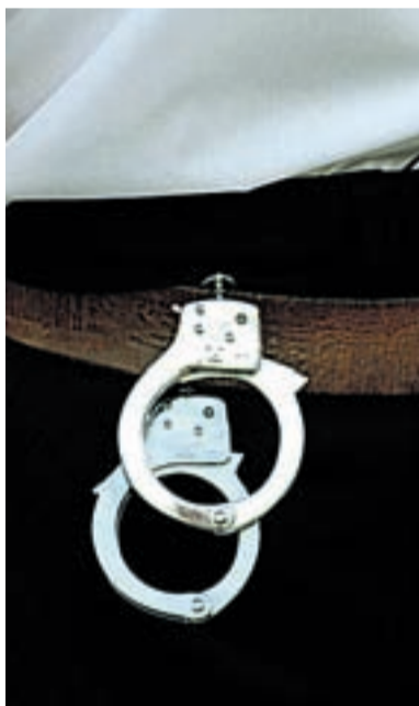
Pealinnal on kuritegevuse vähendamiseks veel palju teha.

Kõige eelneva peale mõeldes tekib tahtmatult küsimus, kas olukorra parandamise kohustus on riigil või saab ka Tallinn ise midagi ära teha. Mina väidan, et esmajoones peabki kuritegevuse vähendamine olema omaavalitsuse ülesanne. Tagajärgedega võitlemine ehk kuritegude avastamine on riigi ülesanne. Kuritegude vähendamine, mis kõigepealt tähendab ennetustegevust, oli, on ja jääb esmalt siiski omaavalitsuse ülesandeks. Hakkab ju ennetustegevus pihata kõigepealt kodust ja haridusasutustest. Nii vanemad, lasteaiad kui koolid vastutavad esimestena selle eest, et ühel kasvaval inimesehakatil oleks piisavalt hea kasvatus, et ühiskonnas toime tulla ja mitte min-