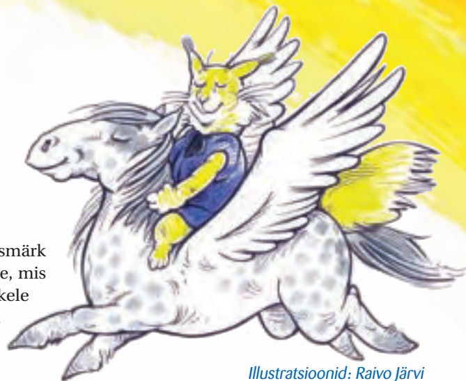
Illustratsioonid: Raivo Järvi

Majanduspoliitikast, eakate elujärje parandamisest ning pere- ja rahvastiku poliitikast loe rubriigist Lubadus!