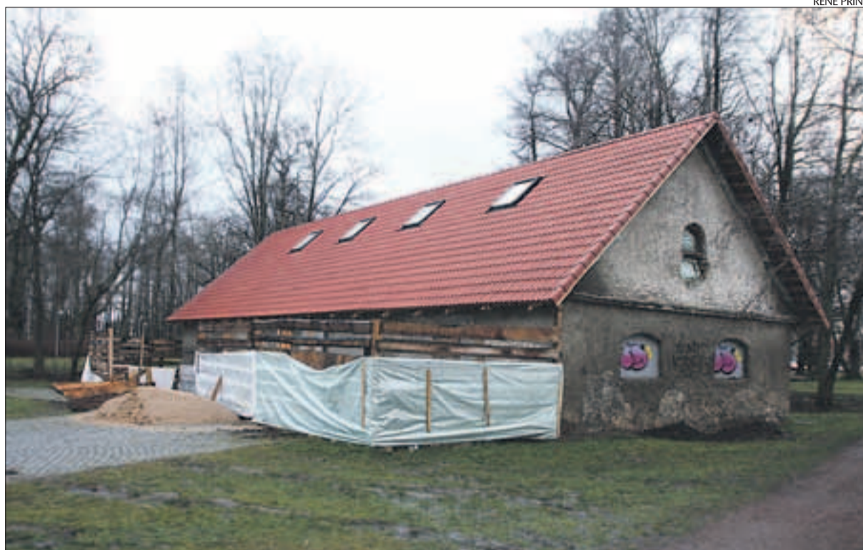
Löwenruh pargi tollakuuri korrastamine on käinud üle kivide ja kändude.

Kena haljasala kesklinna lähedal ja legendaarne tollakuur on andnud inspiratsiooni ka uue Eesti uutele Tallinna valitsejatele. Linnavolikogu 21.06.07 otsusega nr 192 anti OÜ-le Löwenruh 20 aastaks üürile Löwenruh pargis paiknev tollakuur-ait. Otsuse kohaselt peab firma tasuma hoone kasutamise eest üüri 8732 kr kuus (55,5 EEK/m²). Otsuse punkti 2.7.2.1.1 kohaselt peab firma investeerima kaheksa kalendrikuu jooksul pärast äriruumi üürilepingu sõlmimist 3 500 000 krooni ilma käibemaksuta ja otsuse punkt 2.7.2.1.2 kohaselt II etapil 9 kuni 12 kalendrikuu jooksul pä-