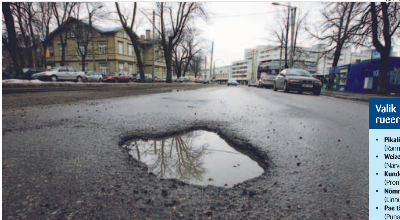
Järgmisel aastal rekonstrueeritakse ka auklik Weizenbergi tänav.