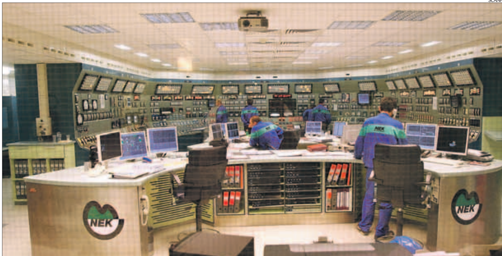
Moodsa tuumajaama rajamine on keerukas ja aeganõudev tegevus, mis nõuab vastava seadusandluse olemasolu.