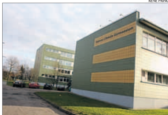
Lilleküla Gümnaasium saab lõpuks renoveeritud.

Lisaks Lilleküla Gümnaasiumile näeb Tallinna 2009. aasta linnaeelarve ette Maistra Gümnaasiumi, Juhkentali Gümnaasiumi ja 53. Keskkooli tervikrenoveerimise. Koolid on plaanis korda teha koostöös partneritega erasektorist ning eelarveks on planeeritud ligi 200 miljonit krooni. Remondi