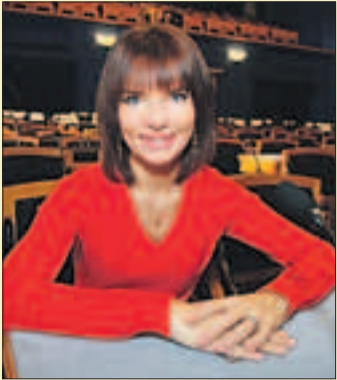
Keit Pentus Riigikogus oma töölaua taga.