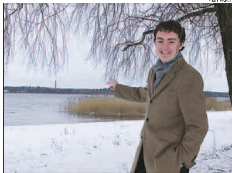
Taavi Rõivas soovib rajada Haabersti eakate hooldekodu Harku järve kaldale.

gusumma on marginaalne osa linnaeelarvest, kuid parandab linnavolikogu toetuse korral märkimisväärselt linnaosa elanike elukvaliteeti.